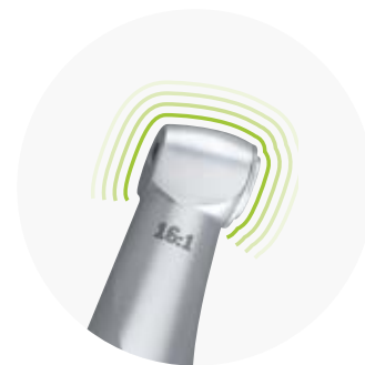
El nuevo minicabezal permite un acceso óptimo al punto de tratamiento