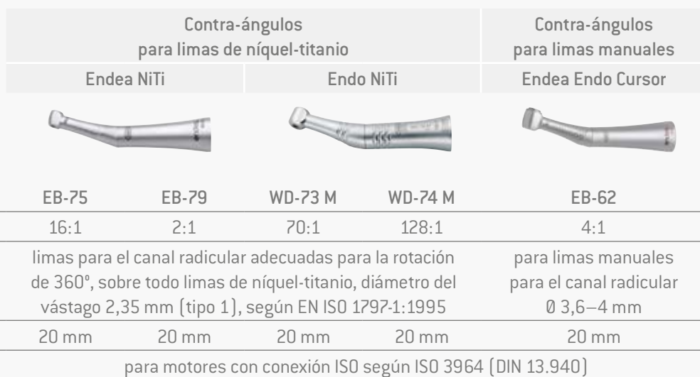
Fig. Fotografías simbólicas. El equipamiento adicional y el contenido de los accesorios mostrados no se incluyen en el volumen de suministro.