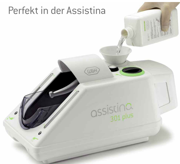
W&H Service Oil F1 in der Ölflasche MD-500 für die Anwendung in der Assistina.

zu 390.000 Upm. F1 sorgt für exzellente Schmierung und Innenreinigung und sichert somit die einwandfreie Funktion der Instrumente.