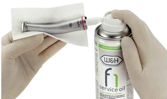
W&H Service Oil F1 in der Spraydose MD-400.

Anspruchsvolle, hochpräzise technische Systeme verlangen erstklassige, hochwertige Pflege: W&H-Dentalantriebe erreichen Spitzendrehzahlen bis