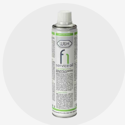
Abb. Symbolfotos. Zusatz-Ausstattung und Inhalt der gezeigten Zubehörteile sind nicht im Lieferumfang enthalten.