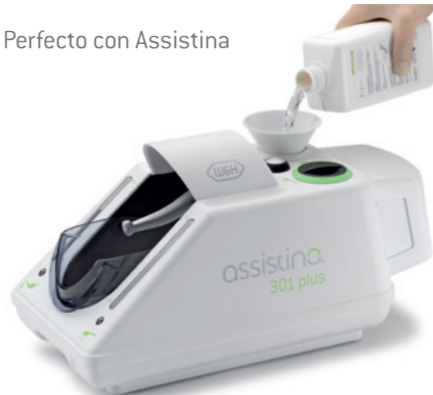
W&H Service Oil F1 en botella MD-500 para su uso en Assistina

el funcionamiento seguro y libre de desperfectos de los instrumentos durante años.