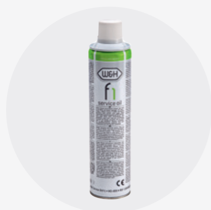
Envase en spray

Las fotografías de la ilustración son orientativas. El suministro original no incluye ni los complementos ni los accesorios aquí mostrados.