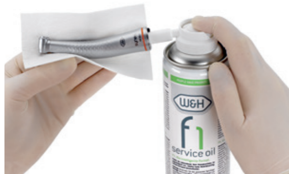
W&H Service Oil F1 en envase spray MD-400

Los instrumentos dentales W&H alcanzan hasta 350.000 r.p.m.. Service Oil F1 proporciona una excelente lubricación y limpieza internas asegurando con ello