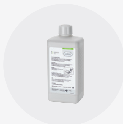
Botella para Assistina