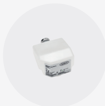
Cartucho para Assistina 3x3 / 3x2