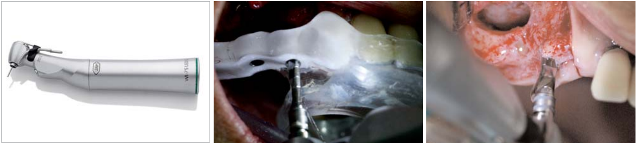
Abb. 8: Chirurgisches Handstück mit Untersetzung 20:1 und Sechskantmitnehmer für maschinelle Implantatinserterion und LED-Ausleuchtung. – Abb. 9: Ausleuchtung der Pilotbohrung bei der Verwendung einer auf Basis von DVT-Daten (Galileos, Sicat, Bonn) erstellten Bohrschablone. – Abb. 10: Weitere Aufbereitung mit Systembohrern unter genauer Ausleuchtung des Operationsgebietes mit innengekühlten Bohrern.

für die Anspeisung der LED notwendigen Strom selbst. Die Anschaffung einer neuen Chirurgieeinheit mit Lichtmotor und Lichtleiter-Winkelstücken ist damit nicht nötig. Diese ersten autarken Licht-Chirurgie-Übertragungsinstrumente werden von W&H als Chirurgie-Handstück mit Übersetzung 1:1 (Abb. 2) und als Implantologie-Winkelstück mit einer Untersetzung 20:1 angeboten. Damit wird der für implantologische Eingriffe notwendige Drehzahlbereich voll abgedeckt. Wobei zu bemerken ist, dass Licht erst ab einer Drehzahl von 300 Upm beim Winkelstück und ab 6.000 Upm beim Handstück zur Verfügung steht.