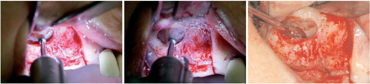
Abb. 5: Gezielte Ausleuchtung des Operationsgebietes bei der Präparation des lateralen Kieferhöhlenfensters. – Abb. 6: Gute Übersicht selbst bei Nutzung der externen isotonischen Kühlflüssigkeit bei vorsichtiger Knochenpräparation. – Abb. 7: Komplikationslose Präparation der Kieferhöhlenschleimhaut nach gewebeschonender Präparation der Schneiderschen Membran.