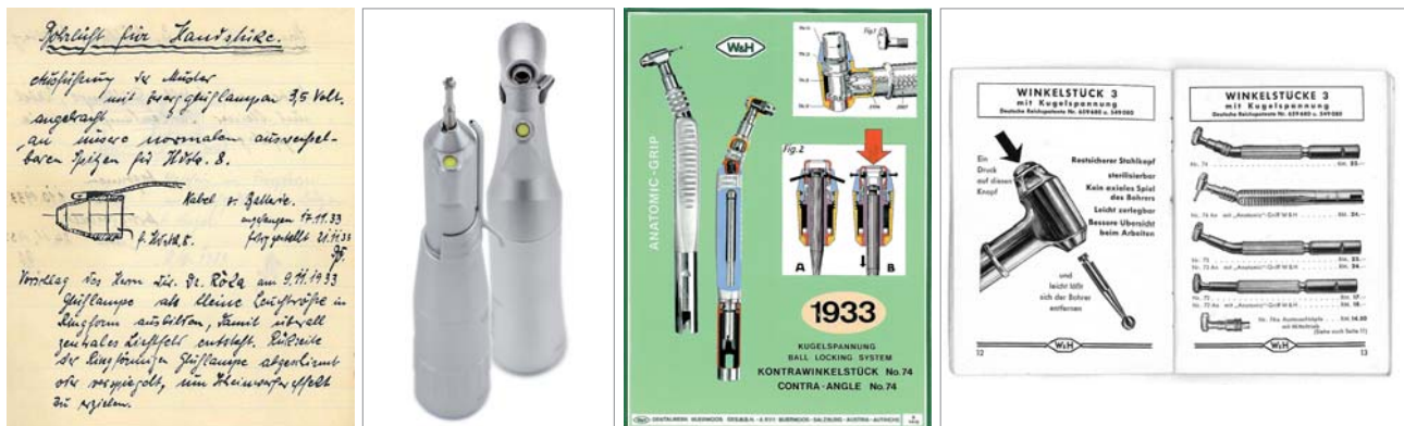
Abb. 1: Konstruktionsskizze für die Entwicklung eines Handstückes mit Lichtleiter aus dem Jahre 1933 (Archiv W&H). – Abb. 2: Chirurgisches Handstück und Winkelstück mit LED-Licht. – Abb. 3: Werbeplakat zur Vorstellung der Druckknopfspannung für zahnärztliche Winkelstücke aus dem Jahre 1933 (Archiv W&H). – Abb. 4: Produktkatalog aus dem Jahr 1935 mit Sortiment von verschiedenen Instrumenten mit Druckknopfspannung und anatomischen Griff (Archiv W&H).

Für die chirurgische Anwendung mit der Notwendigkeit der Sterilisation kann seit der IDS 2007 mit einem sterilisierbaren LED gearbeitet werden. Besonders für die chirurgischen Instrumente ist die integrierte LED mit eigenem Generator im Instrument von Vorteil, da diese auf den normalen herkömmlichen sterilisierbaren Mikromotoren verwendet werden können. Die sterilisierbare LED leuchtet das Behandlungsareal mit Tageslichtqualität aus. Der eingebaute Generator erzeugt den